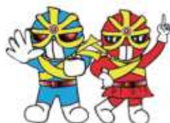
広島県警察反射材活用促進キャラクター「キラリ☆マン・キラリ☆ウーマン」