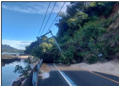
(主) 高田沖美江田島線