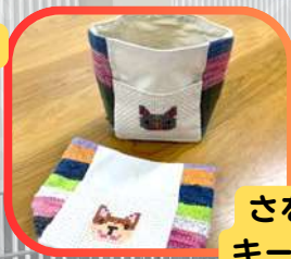
さをり織り キーホルダー 缶バッジ