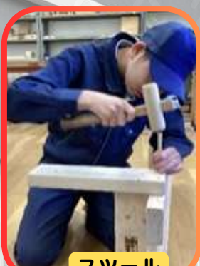
スツール スマホスピーカー