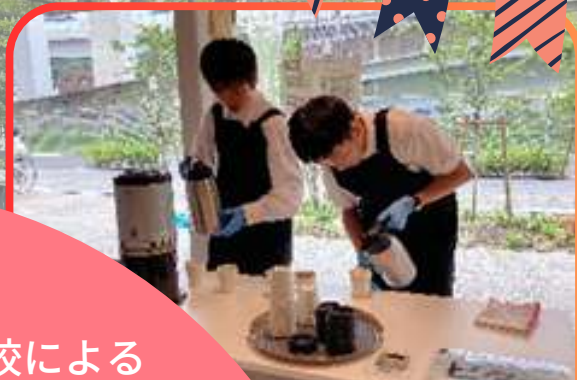
地元コーヒー専門店 とコラボ開発した ブレンドコーヒー