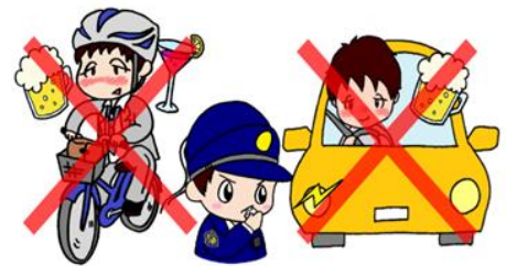
飲酒の有無別死亡事故率(令和5年中)

年末にかけて飲酒の機会は増えると思いますが、お酒を飲んだら絶対に運転をしてはいけません!!!