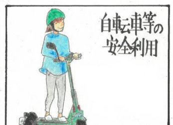
自転車等の安全利用