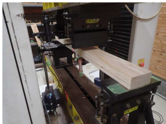
写真1 広島県産コウヨウザン LVL 曲げ試験 写真2 茨城県産コウヨウザン LVL 曲げ試験