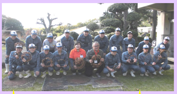
リースを作ってくれた 広島県立沼南高等学校のみなさん