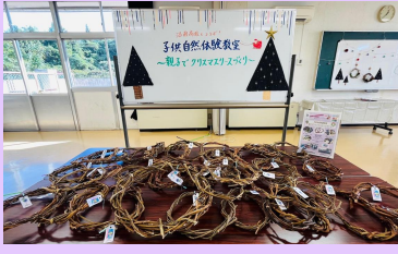
沼南高校から贈呈されたリース