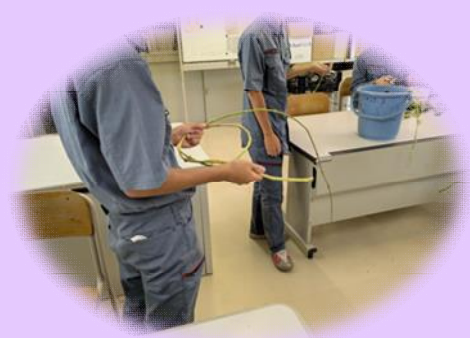
しっかりとリースを 編んでくれました。