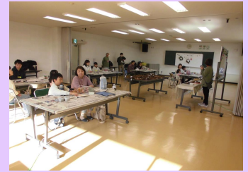
5家族 14名の参加をいただきました