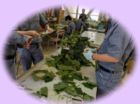
蔓から葉っぱをていねいに 取り除き...