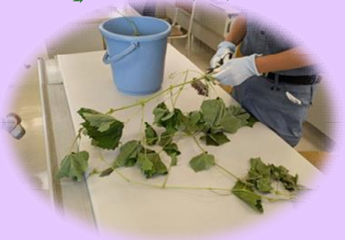
今回のクリスマスリースづくりは これを使用して 行いました!