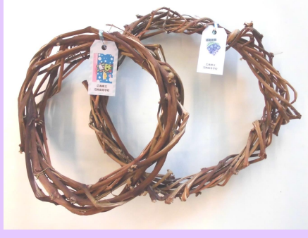
広島県立沼南高等学校 園芸デザイン科の 生徒が育てたブドウの 蔓(つる)で作ったリースを いただきました。