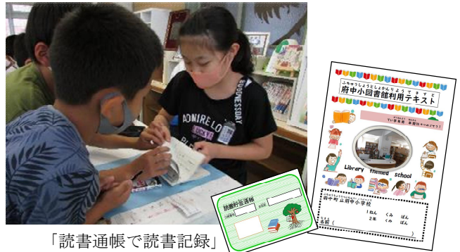
「読書通帳で読書記録」 府中町立府中小学校

各学校では、児童生徒の発達段階や実態に応じ、様々な本に触れる機会の確保や読書への関心を高める取組など、本に親しませる様々な取組が行われている。