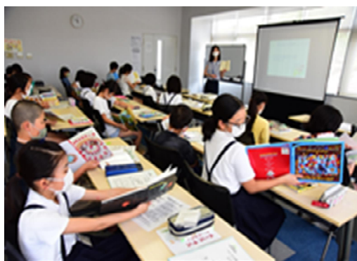
【三原市「子ども司書」の活動】

また、小学校、中学校、高等学校、特別支援学校の新学習指導要領において、学校図書館に関する役割が明記されている。総則では、「学校図書館を計画的に利用しその機能の活用を図り、児童（生徒）の主体的・対話的で深い学びの実現に向けた授業改善に生かす」とされている。