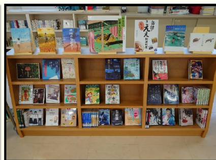
高校生向けセットと所蔵本(主に新しく入荷した本)

成果として、環境整備を行ったことで、児童生徒が学校図書館へ積極的に足を運ぶようになり、来館者数や貸出冊数が増加していることが挙げられる。モデル校の取組や実践事例については、県教育委員会が作成した「学校図書館リニューアルの手引」に掲載している。