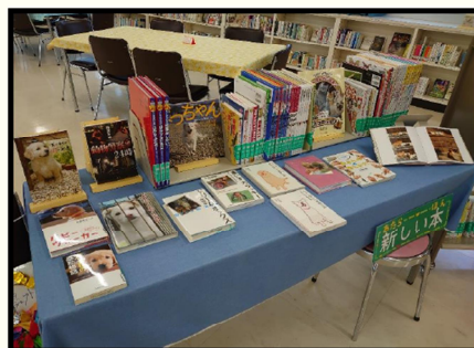
R3.図書館だよりおすすめ:動物の命(主に犬)