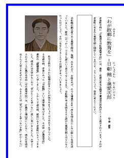
地域教材の開発や活用 （三次市立八幡小学校）