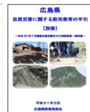
広島県自然災害に関する防災教育の手引き