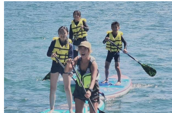
子ども達と SUPイベント