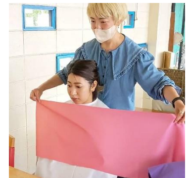
パーソナルカラー & 骨格診断