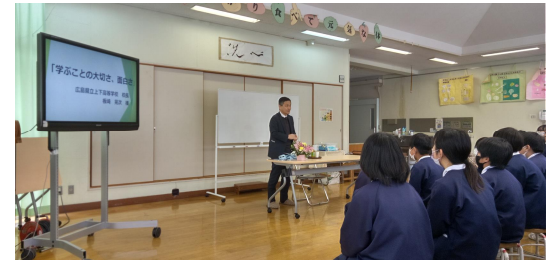
県立上下高校の校長先生による講話風景 (小学校5・6年生対象)