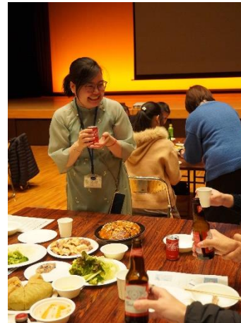
【ベトナムテトの日】の様子