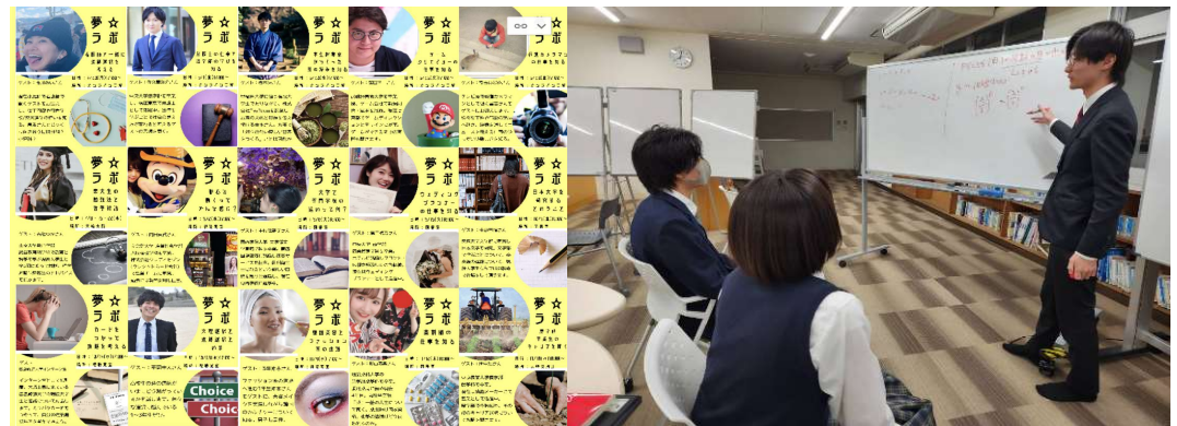
公営塾で行われている講座 「夢★ラボ」のプロジェクト

大崎海星高校生が進学やそれぞれのキャリア発見のために協力して挑戦できる環境が整っている。