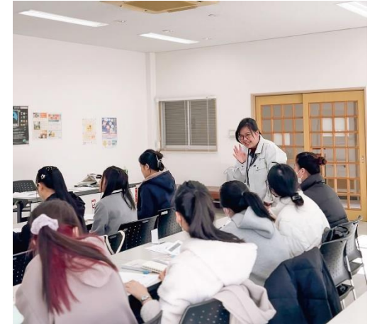
【日本語教室のサポート】

今回のイベントを機会に小さなベトナム人コミュニティが出来たので、これからだんだんと安芸高田市のベトナム人コミュニティとして育てていきたいです。