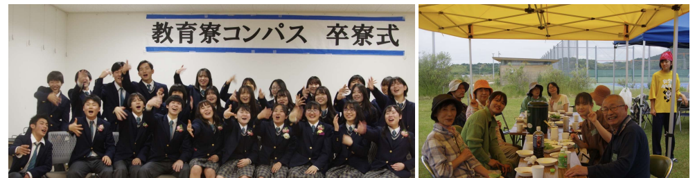
3年間過ごした生徒たちの卒寮の様子 島親さんとの交流会の様子