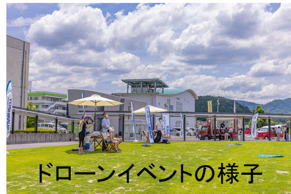
ドローンイベントの様子