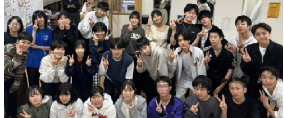
入寮してすぐの交流会の様子

また、高校と町職員、ハウスマスターとの生徒情報交換のための会議を隔週で設けており、島全体で受け入れた離島留学生の能力を最大限引き出そうと試みている。