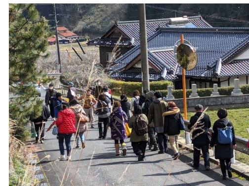
空き家を巡るツアー