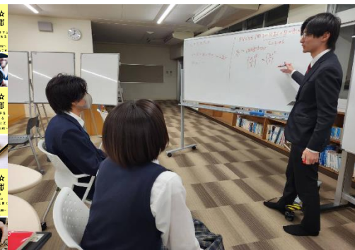
公営塾での授業の様子