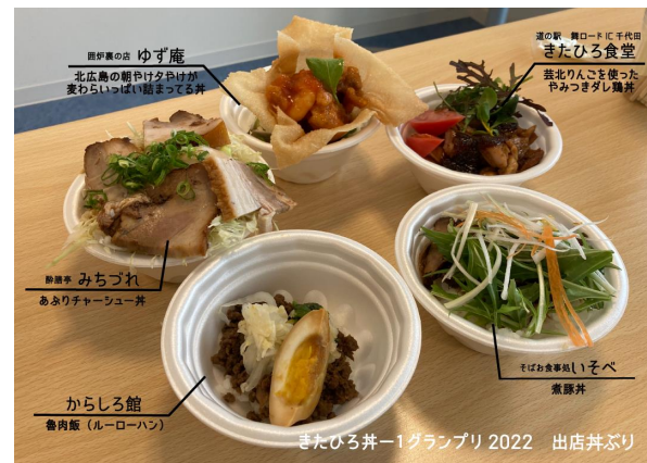
井-1グランプリ 2022 出店井ぶり 西野農の会 ゆず庵 北広島町の郷土揚げが 変わらないうまい詰まってる井 道の駅 興ロードに千代田 きたひろ食堂 芸北り人ごを使った 丹みっぎだし鶏井 新井 みちづれ あかりチャーシュー井 からしる館 魯肉飯（ルーローハン） くぼい食堂 しいそべ 煮豚井