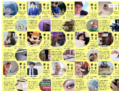
公営塾で行われている講座 「夢★ラボ」のプロジェクト

大崎海星高校と一体となった公営塾の運営。確かな学力作り(教科指導、受験指導)、心から納得する進路発見(キャリア教育)の2本柱で個別最適な指導を行い、進路実現を図っている。(塾生から国公立大学、私立大学、公務員試験の合格者を複数名輩出)