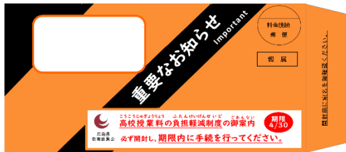
オレンジ色の封筒

① もうしこ ひつよう ① 申込みに必要な ログインID と パスワード が書いてある 通知文 が、4月15日頃までに郵便で届きます。