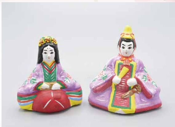
下川原土人形 青森県 頼山陽記念文化財団蔵(川手コレクション)