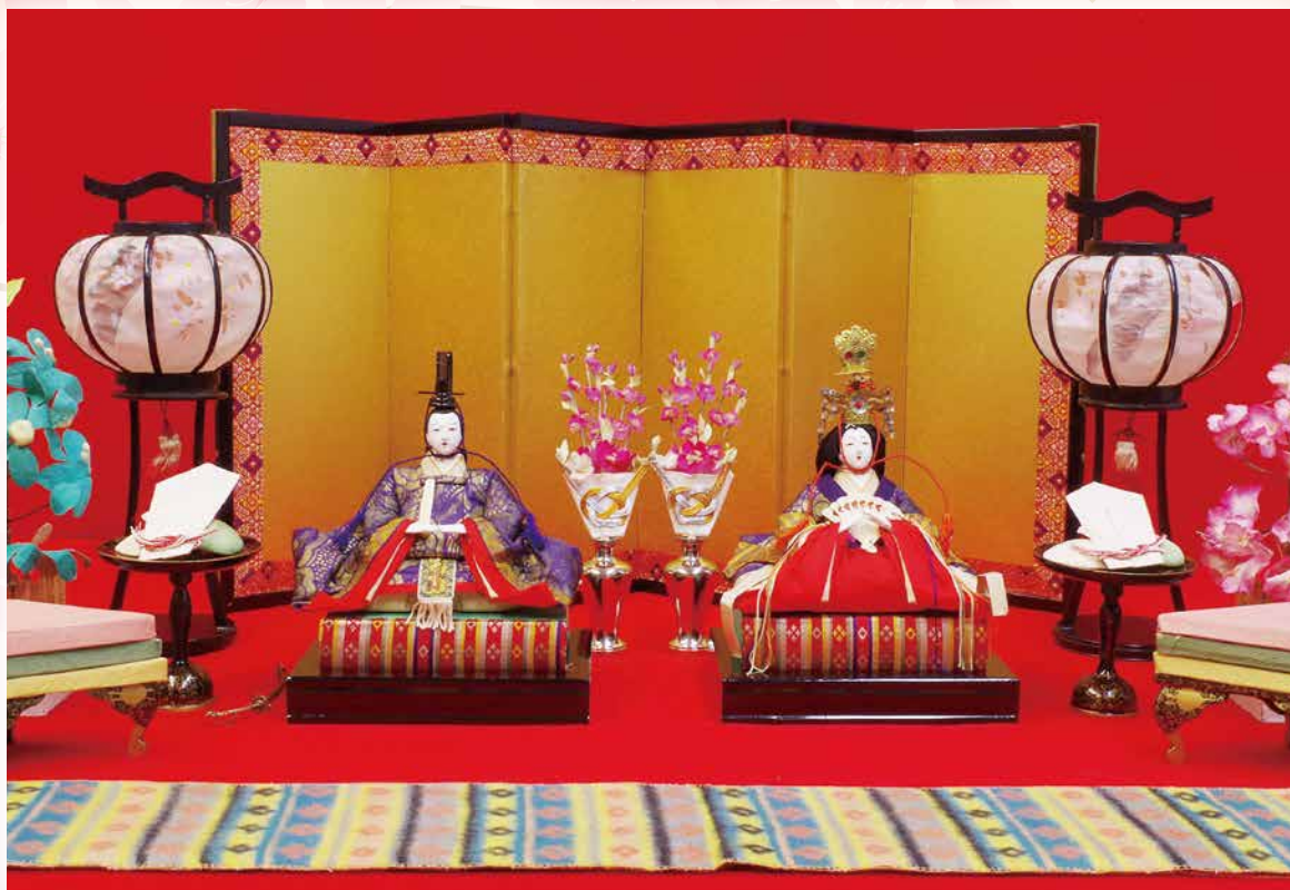
大正末期～昭和初期のひな人形(個人蔵)