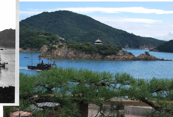
左：（瀬の浦）仙酔島及弁天島（対潮楼より見たる）（大正7年（1918）～昭和8年（1933）までの間に製作） 右：福禅寺対潮楼から見た現在の風景