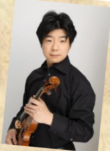
ヴァイオリン 竹内弦 (広島交響楽団)