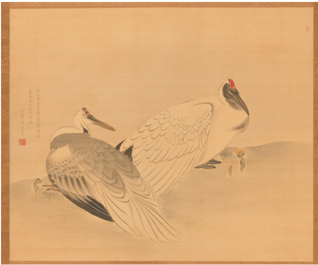
そうかくず かきざきはきょう 双鶴図 蠣崎波響画

文化14年(1817)、茶山の古希の祝いとして、松前藩家老で画家の蠣崎波響から贈られた絵