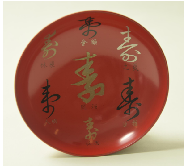
寿杯 松平定信所贈

文化14年(1817)、茶山の古希の祝いとして、松前藩家老で画家の蠣崎波響から贈られた絵