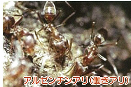
アルゼンチンアリ(働きアリ)