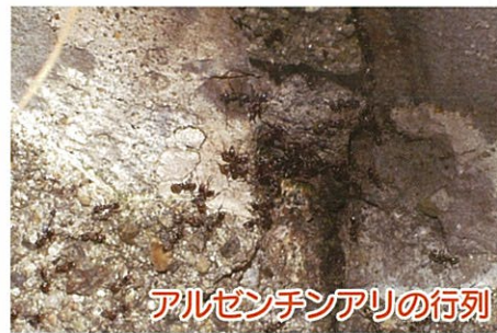
アルゼンチンアリの行列