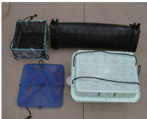
写真：試験に使った籠

H18～20年度に実施した「一粒かき養殖の定着化技術開発研究」のフォローアップ研究として、一粒かきの籠養殖技術について確認試験を行っています。品質工学的な手法を取り入れて最良との結果が示された籠、観察の容易さや出し入れ等の作業性が良く、上面開口型で浮揚性の籠（現場での普及を想定）、さらにオーストラリアのカキ養殖業者の間で普及している樹脂製でパイプ状の籠の3種類について、使いやすさ、値段、生産性の面から評価をしています。今年のチームは新たにベテランが加わり、新しい視点で試行錯誤をしながら、新たな展開を目指しています。