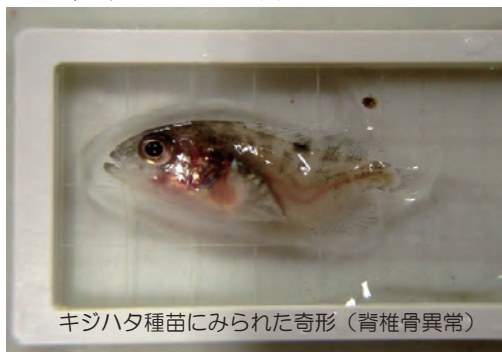
キジハタ種苗にみられた奇形（脊椎骨異常）

地付き魚生産チームでは7月7日に（独）水産総合研究センター玉野栽培漁業センターよりキジハタの受精卵を受け入れ種苗生産技術開発に取り組みました。今年度は脊椎骨の異常が認められる個体が多く発生し、奇形率は42.6%を占め、難しい種苗生産となりました。海産魚類の奇形発生の原因については様々な説がありますが、今回のような事例は技術開発を行う上で重要な知見になると考えられます。今回生産した種苗の奇形発生部位と発生状況を整理し、原因の究明に今後取り組みたいと考えています。