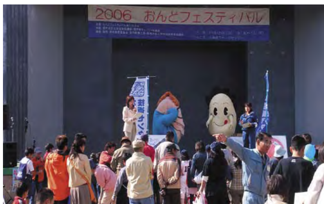
写真 1 ステージで「おさかな〇×クイズ」

図 水技センターの新しいキャラクター めに、会場（センター）全体をオリエンテーリングのゲーム形式で巡っていただくようにアレンジしてみました。結果は上々。迷子になる方もなく、ほとんどの方にすべてのブースをまわっていただくことができました。