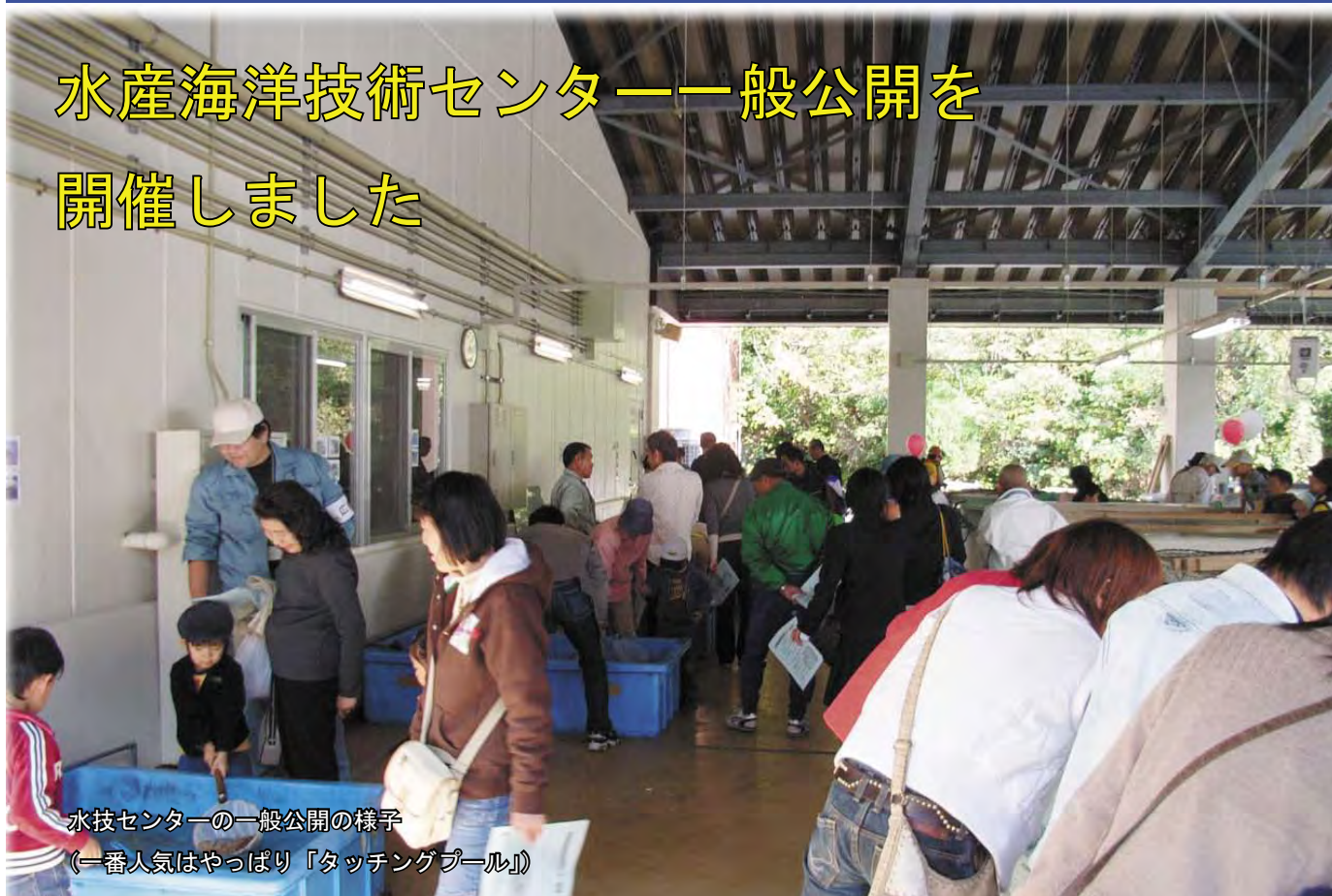
水技センターの一般公開の様子 (一番人気はやっぱり「タッチングプール」)

平成 18 年 11 月 12 日（日）に、水産海洋技術センターの一般公開を行いました。前日 11 日は朝から雨。お天気がとても気になりましたが、12 日当日は冷たい風が吹きながらも雨は上がり、何とか予定どおりの展示をすることができました。