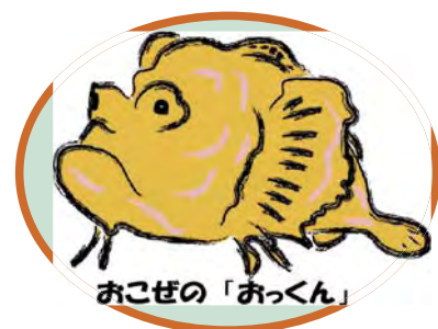
図 水技センターの新しいキャラクター めに、会場（センター）全体をオリエンテーリングのゲーム形式で巡っていただくようにアレンジしてみました。結果は上々。迷子になる方もなく、ほとんどの方にすべてのブースをまわっていただくことができました。

また、去年の一般公開の際に来場者のみなさんから寄せられたご意見・ご感想を元に、展示の内容をより「体験型」にし、順路を分かりやすくするた