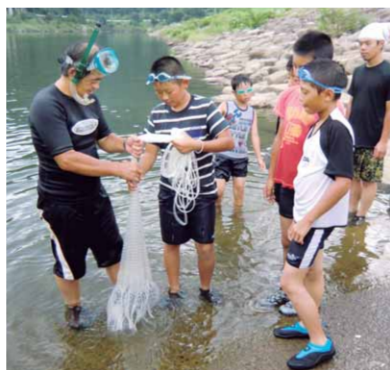
川漁体験活動（三次市立川地小学校）