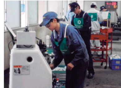
高校生ものづくりコンテスト全国大会（旋盤作業部門）で活躍する生徒

セミナーを受講した生徒が「高校生ものづくりコンテスト」において優秀な成績を収め、全国大会へ出場した3名（3部門）に広島県知事賞、中国地区大会へ出場した17名（7部門）に広島県教育長賞が授与されました。