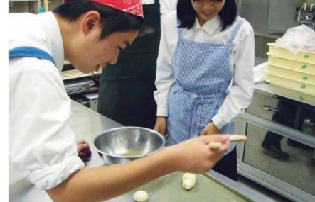
米粉専門店「す米（まい）」（広島商業高等学校）

起業活動実践校の1つである広島商業高校では、米粉の販売促進のため、産官学連携を積極的に行って米粉レンビの開発に取り組み、開発したレシピや料理を紹介しながら米粉を販売しました。そして、この取り組みを「全国高等学校生徒商業研究発表大会」で発表しました。