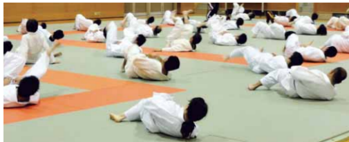
柔道指導実践講座

広島県では 中学校保健体育科教員を対象に、武道の指導方法や安全指導についての研修会（平成21年度）や、実践的な講座（平成21～23年度）を開催しました。特に柔道については、安全確保の観点から、指導するすべての教員が平成23年度末までに安全指導を含む実技研修会を受講し、全日本柔道連盟が作成している冊子「柔道の安全指導」を活用するよう指導を行ってきました。