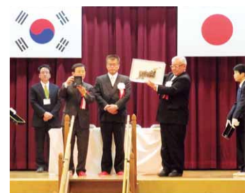
姉妹校提携調印式（三原特別支援学校）

特別支援学校として初めて、三原特別支援学校が韓国・ソウルのミラル学校と姉妹校提携を行いました。学校訪問や作品交換などの交流が行われます。