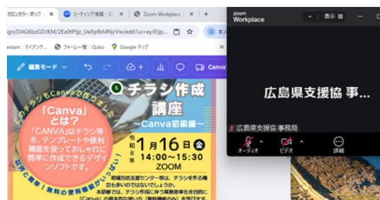
PCの左側にCanvaの画面、 右上にZOOM画面

Canvaを操作する際は、視聴中のZOOM画面を小さくする等、工夫をお願いします。