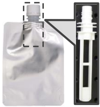
スパウト (パウチ飲料のストロー)