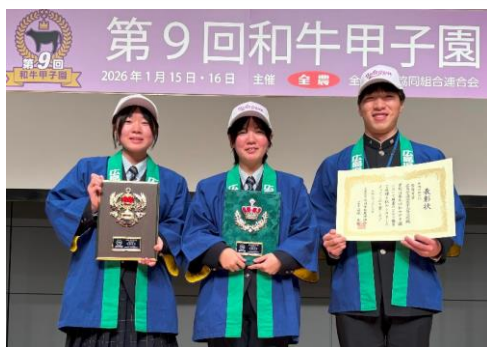
(写真) 表彰式を終えた西条農業高校の皆さん。笑顔がまぶしいです！

令和 8 年 1 月 15 日(木)～16 日(金)、品川グランドホール及び東京都中央卸売市場食肉市場(東京都港区)にて、JA 全農主催の「第 9 回和牛甲子園」が開催されました。この催しは、北は北海道、南は鹿児島まで、全国の農業高校から和牛を飼育する「高校牛児」たちが一堂に集い、和牛の飼養管理の工夫や枝肉の仕上がりを競うもので、今大会は、過去最多となる 43 校、65 頭がエントリーし、広島県からは西条農業高等学校(東広島市鏡山)と庄原実業高等学校(庄原市西本町)の 2 校が昨年に引き続いて参加しました。