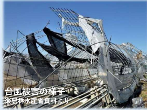
台風被害の様子 ※農林水産省資料より