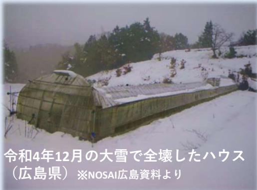
令和4年12月の大雪で全壊したハウス (広島県) ※NOSAI広島資料より