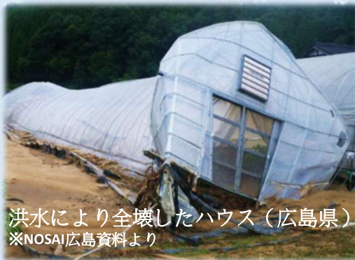
洪水により全壊したハウス(広島県)