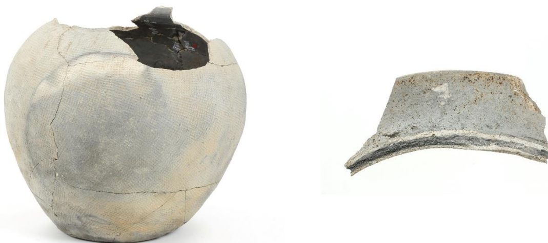
修理前の状況（左：頸部より下の部分、右：接合前の口縁部破片）

修理では、まず、土器に付着した接着剤及び石膏を除去し、土器を一度解体した後、破片に対してクリーニング及び強化処置を行った。その後、破片を再接合するとともに、脆弱部を樹脂で補填し、捕彩を行った。再接合に当たっては、従来接合されていなかった口縁部の破片を新たに接合した。また、自重によって土器に掛かる負担を軽減するため、専用の支持台を作成した。