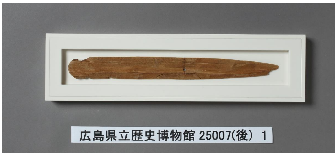
修理後の状況（上：支持台なし、下：支持台あり）