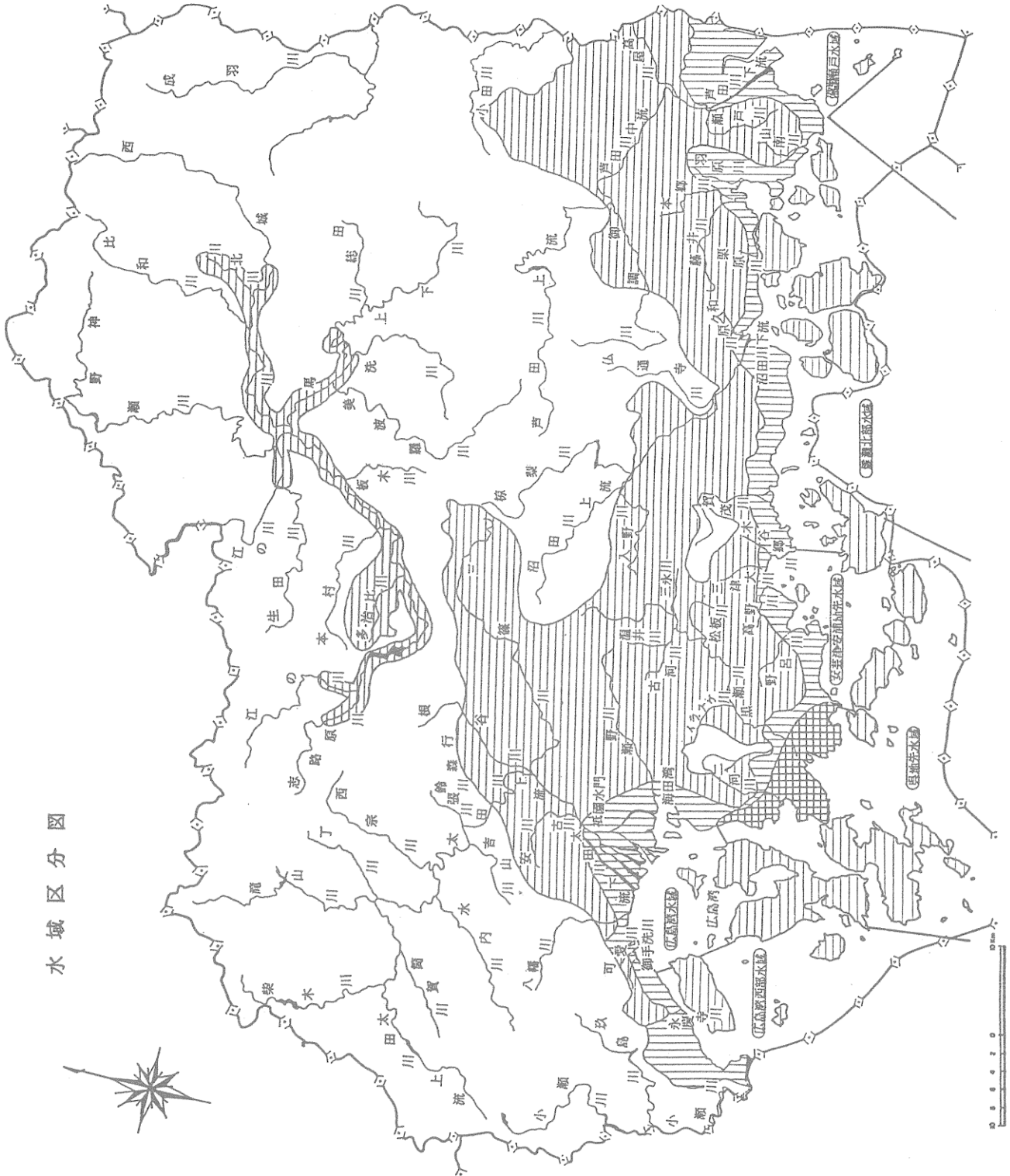
水 域 区 分 図