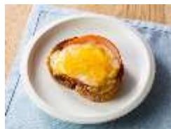
オレンジマレードの ハムチーズトースト

低糖度ジャム「アヲハタ55」と、タカキベーカリーの「石窯パン」「バラエティブレッド」を組み合わせたイベント限定のセットです。メニュー開発には安田女子大学の管理栄養学科の学生も加わり、「朝起きるのが楽しみになるような朝食」をテーマに若者視点で食材の組み合わせにこだわって検討しました。イベント当日は、こだわりの4種類のメニューから、一人1セットが選べます。