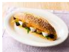
アンズとカマンベール チーズのカスクート