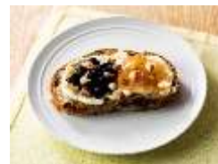
イチジク&ブルーベリーと クリームチーズのパン