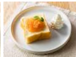
白桃&グアバと ミルクブレッド