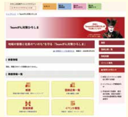
② Teamがん対策ひろしま特設サイトを開設中!

県のホームページに、企業概要や取組、目標などを掲載し、登録企業を積極的にPRします。また、登録式や表彰式といった各種イベントを企画し、マスコミにも働きかけてメディアへの露出機会を増やします。