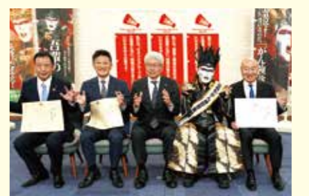
③ 表彰式は広島県副知事・デモン閣下が出席し、代表者に賞状を授与します。

登録企業は、年に1回(8月)、1年間の取組と目標の達成状況について報告してください。県はその報告内容を審査し、特に優秀な成果をあげた企業、又は、特に県内企業の模範となる先導的な取組を行った企業等を表彰します。