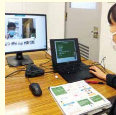
① オンラインでの出前講座にも取り組んでいます。

年1回、がん治療と仕事の両立支援に関する勉強の場として、「両立支援セミナー」を開催します。その日から始められる実践的内容を学ぶことができ、大変好評です。