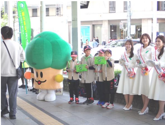
街頭募金の様子(令和7年度)

県民のみなさまの緑化推進意識の向上にもつながりますので、是非取材いただきますようお願いいたします。