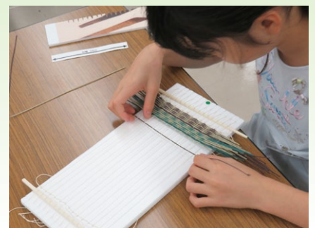
「い草のコースターを作ろう」の様子