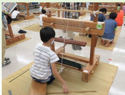
こども博物館教室「い草を織ろう」の様子