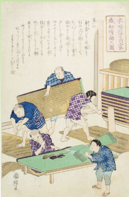
浮世絵 畳織の図(部分、当館蔵)

本展では、当館所蔵資料を中心に、備後表の歴史を紹介するとともに、現在行われている備後表製作技術などの保存・継承活動もあわせて紹介します。