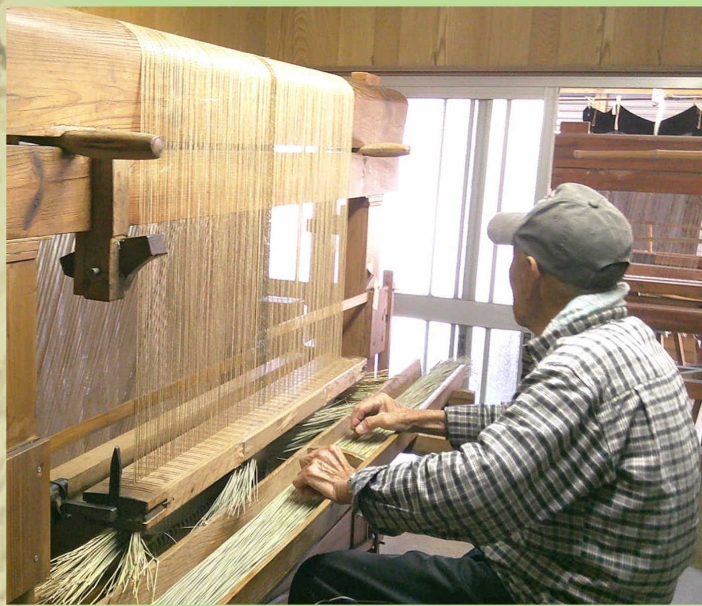
来山淳平氏(国選定保存技術「手織中継表製作」保持者)