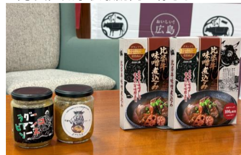
(写真) 完成した比婆牛加工品。