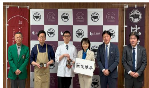
(写真) 知事表敬訪問の様子。

さらに、3月21日にはひろしま夢プラザ、22日には山陽自動車道小谷サービスエリアでテスト販売を行い、訪れた観光客等から好感触を得ることができました。