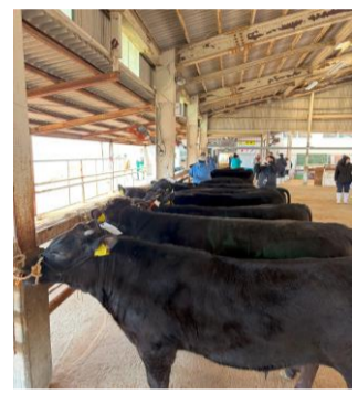
(写真左) 取引の様子。(右) 繋留場での候補牛の様子。