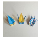
3 家族や友達に呼びかける