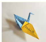
1 おりづるを折り写真や動画を撮影