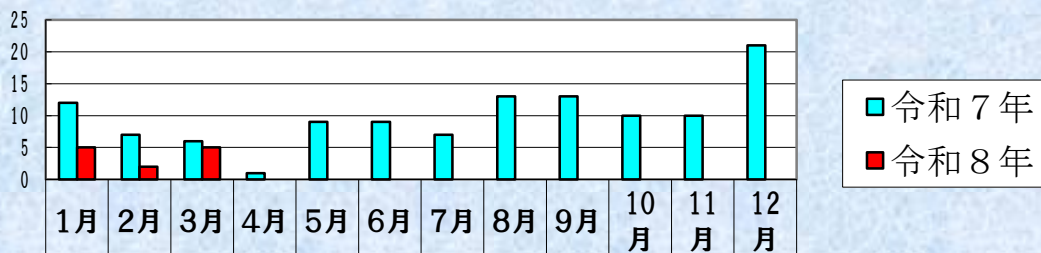
人傷事故月別発生状況