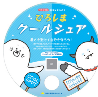
うちわ型チラシ (直径20cm程度) ※画像はイメージです。