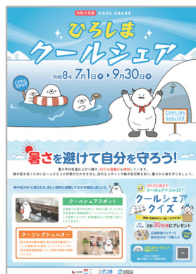
ポスター (A2サイズ) ※画像はイメージです。

※ポスター・チラシの送付をご希望の施設には、一施設あたり、ポスター2枚、うちわ型チラシ15枚の送付を想定しています。送付枚数についてご希望があれば、参加申込みフォームのご意見欄にご記入ください。