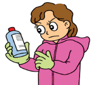
農薬ラベルを確認