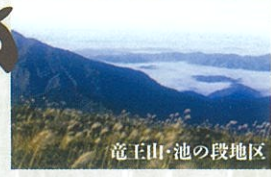
竜王山・池の段地区