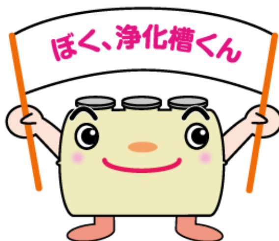
広島県浄化槽キャラクター