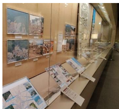
県立歴史博物館への長期展示