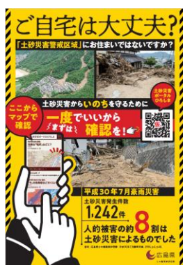
ポスター・チラシの掲示