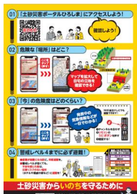
県手数料レシートへの掲載