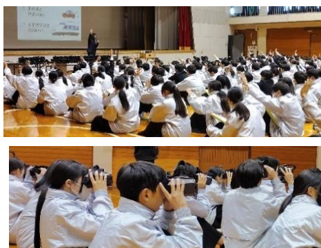
出前講座(座学、VR体験)