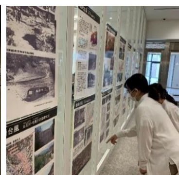
土砂災害伝承パネル展