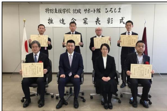
就職サポート隊ひろしま推進企業の表彰

就職者のうち、登録企業に就職した者の割合は、令和7年度は約67%であった。直近の5年間は、約5～7割程度の就職者が登録企業に就職している。（【表3】）