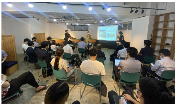
図1 過去の交流会の様子

サイバーセキュリティに取り組むホワイトハッカーを育成する企業や、ジビエで地域活性化を支援する企業 など、10社の経営者やマネージャーが集います。広島に進出した理由や、広島での活動状況等について発表する予定ですので、記者の皆様の情報収集の一助になりましたら幸いです。