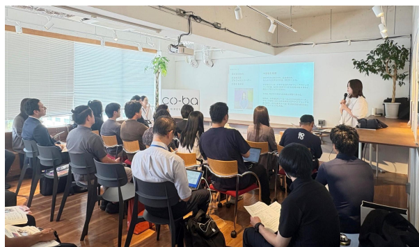
図2 過去の交流会の様子