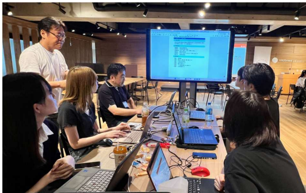
プロトタイピングの様子