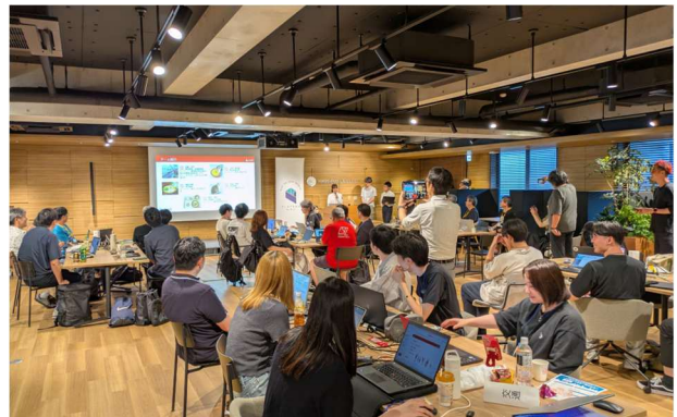
アプリケーションなど成果発表