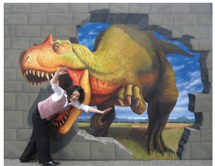
「アロサウルス」