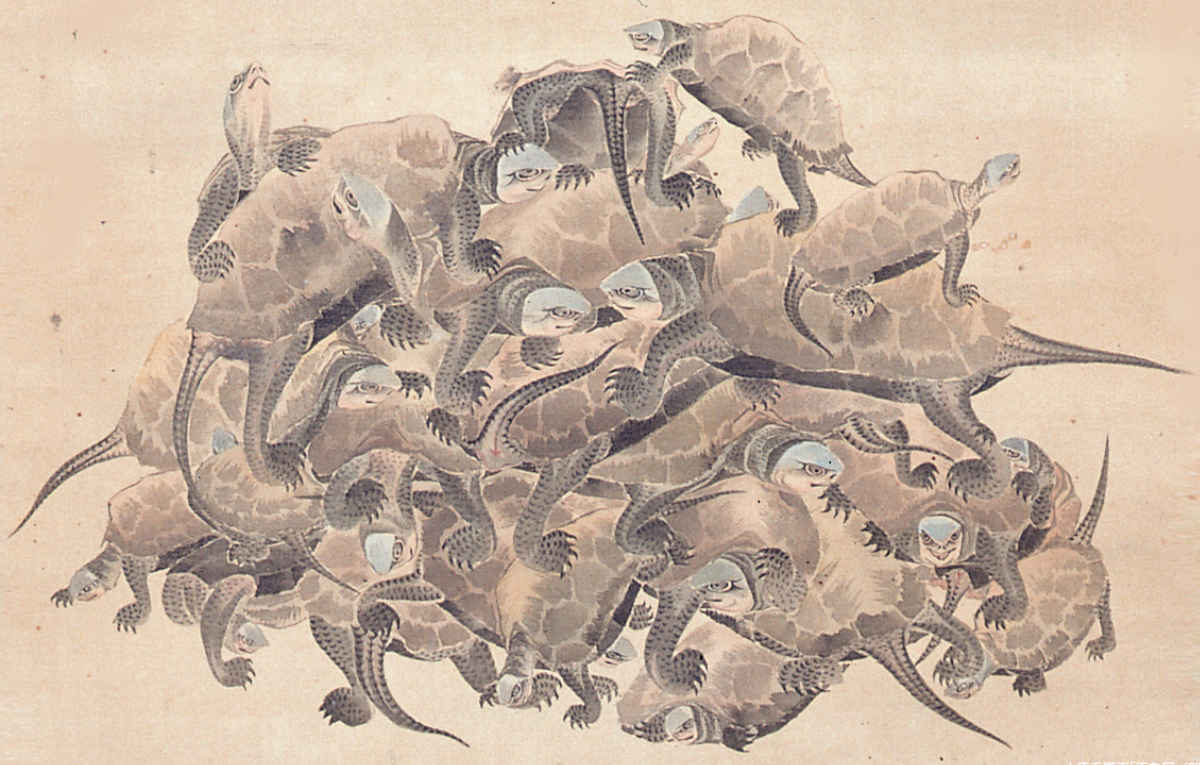
大原香翁画「百亀図」(部分、個人蔵、当館寄託)