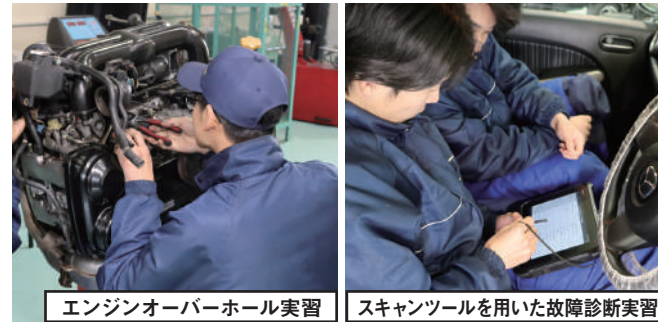
エンジンオーバーホール実習