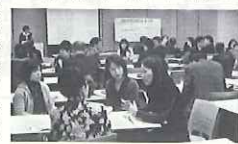
「広島県生涯学習実践交流会」の様子

併せて、毎月1回「メールマガジン」ぱれっと通信も配信しています。昨年11月には、平成16年の配信開始から数えて、100回目の配信を行いました。今後も、読者を意識した情報を選択し、旬の情報を配信していきます。