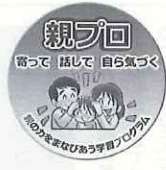
ロゴマークの活用で「親プロ」を更にPR

さらに、現代的課題に対応した教材の開発や既存のプログラムの改善、新たな学びの場の開拓など、広域的な観点から、市町の家庭教育支援の取組を活性化するための仕組みづくりを進めています。