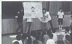
「ワクワク学び隊」の活動の一場面

活動への参加の支援を目的として、大学生ボランティアチーム「ワクワク学び隊」を放課後子ども教室に派遣する事業を行っています。広島県内の大学からチームの登録を募り、当センターで市町からの派遣依頼との調整を行っています。活動内容は、レクリエーション、英会話、科学実験などバラエティに富んでいます。市町からは「子どもたちは、大学生が来てくれることを楽しみにしています。大学生からは「子どもたちがたくさんさんの経験をさせてあげたい」などの声が聞かれ、子どもたちや大学生にとっても大変有意義な事業となっています。今年度はチームの登録数を増やし、1件でも多くの市町の派遣依頼に応えていくなど、本事業の目的を達成することを目指します。