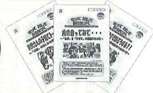
ワークシートを活用した学習