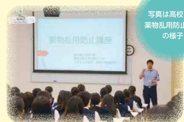
写真は高校での薬物乱用防止講座の様子