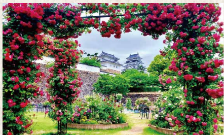
福山駅北口スクエア