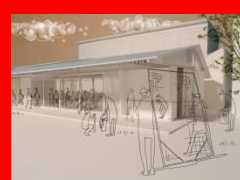
ひろしま建築学生チャレンジコンペ2016 (「広島県立広島工業高等学校 野球部・弓道部室」)

[日時] 2017年3月21日(火) から3月27日(月) まで 午前10時30分から午後8時まで ※初日は午後1時から、最終日は午後1時まで [会場] 広島ブランドショップ TAU 階段スペース (東京都中央区銀座1-6-10)