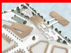
広島型建築プロポーザル (「広島宮島地区旅客ターミナル」) (「グローバルリーター育成校(仮称)」)