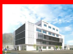
広島型建築プロポーザル (「広島東警察署」)