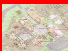
広島型建築プロポーザル (「広島東警察署」)